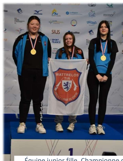
Équipe junior fille, Championne de France pistolet standard 10 mètres